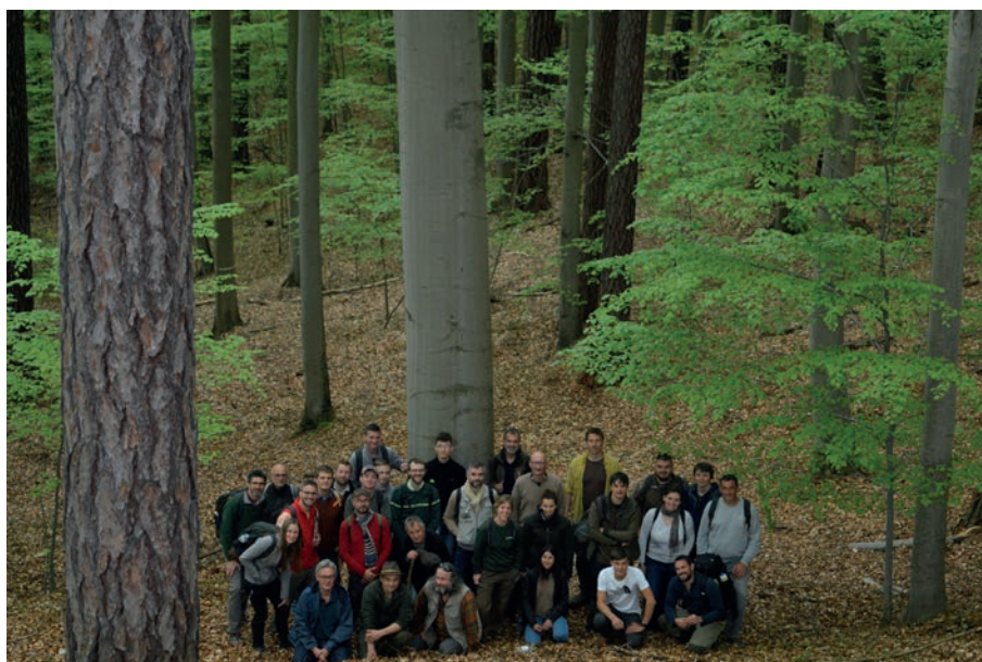
7.4. Les participants français au voyage d'étude en Europe centrale en avril 2023 au pied d'un hêtre monumental dans la forêt d'application de l'université Mendel, à proximité de Brno.