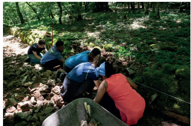
7.6. Restauration des murets bordiers d'un chemin fossilisé sous la forêt à la Place aux Laides sur le mont Beuvray, lors du chantier organisé en août 2023 sous l'égide du programme INCULTUM, en partenariat avec les associations Rempart et Tremplin, Homme et Patrimoine.

Le printemps a été animé par des immersions sur site, en partenariat avec la Société d'Histoire naturelle d'Autun, autour d'observations naturalistes. Ces initiations ont eu pour but de sensibiliser le public au monde végétal, grâce à l'observation et à l'identification. Les sujets abordés sont allés de la fougère, à la compréhension des biotopes, des zones humides et autres tourbières. Plusieurs communes du Grand Site ont accueilli ces événements : La Comelle, Glux, Saint-Léger, Millay, La Comelle... (voir l'éphéméride infra ).