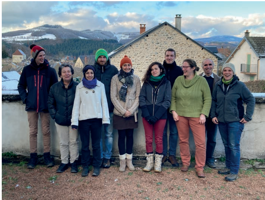
7.5. Les membres fondateurs de l'association du Mont Beuvray, entraide et compagnie, créée et labellisée GIEE par le ministère de l'Agriculture en 2023.

Deux membres de l'équipe se sont rendus fin avril à Uppsala pour participer au séminaire annuel d'INCULTUM. Le suivi de cette coopération européenne s'est également traduit par une participation active à la rédaction de l'argumentaire d'un nouveau projet qui a