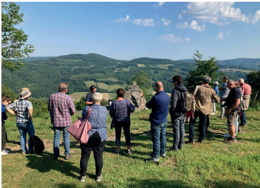
7.2. Lecture de paysage sur le mont Beuvray, à la Roche Salvée, le 8 juin 2023 dans le cadre de la préparation du cahier de gestion des sites classés du Mont-Beuvray et du Mont-Préneley – Sources de l'Yonne (cliché Bibracte/Sophie Mobilion).