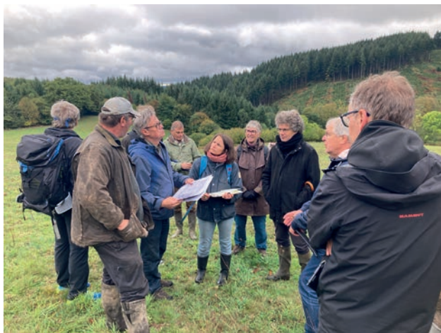
7.3. Cartographie des aménagements hydrauliques à proximité du hameau du Rebout St-Léger-sous-Beuvray) le 24 octobre 2023 avec l'équipe de l'ONG tchèque Ziva Voda (cliché Bibracte/S. Mobillion).

Sur le volet forestier, la démarche Grand Site de France s'appuie sur les travaux du Laboratoire d'expérimentation forestière sur le site classé du mont Beuvray qui est passé en phase opérationnelle début 2022 avec des travaux de terrain concentrés sur le mont Beuvray (cf. supra , chapitre 6).