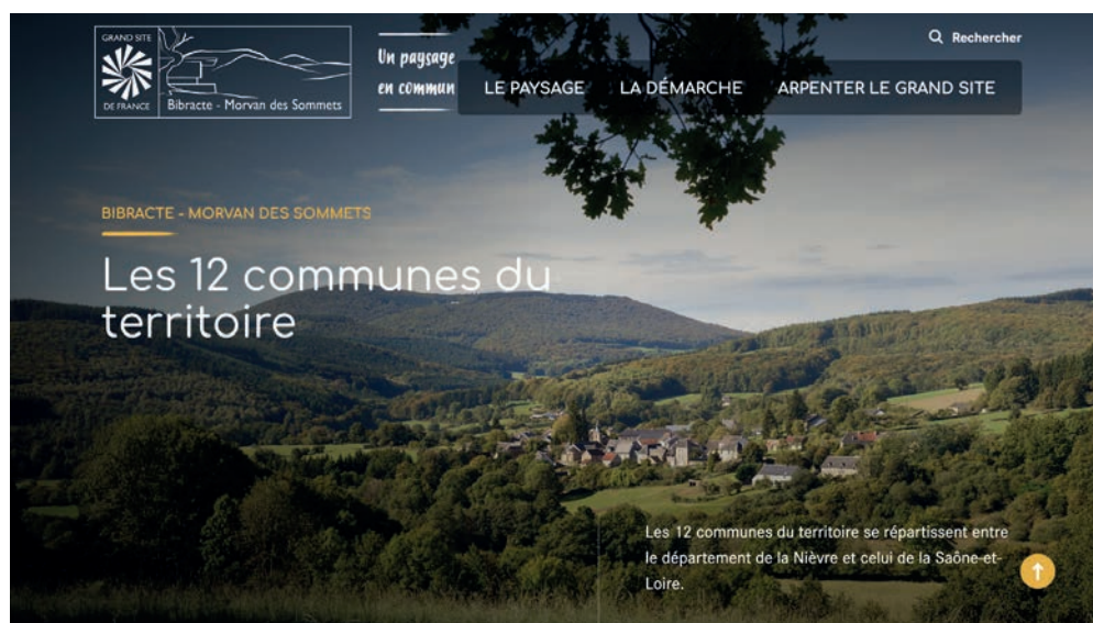
7.1. la page d'accueil du nouveau site internet du Grand Site de France Bibracte – Morvan des Sommets (conception et réalisation : Flore Coppin ; Agence Catapulte, Dijon).

Le chantier ouvert début 2023 a été l'occasion d'une concertation large avec les acteurs locaux et institutionnels, qui s'est concrétisée notamment lors de la « navette des paysages » le 8 juin. Une trentaine de participants a parcouru ce jour-là les deux sites classés sur les thèmes des espaces forestiers et agricoles, du bâti, du patrimoine et des mobilités (ill. 7.2). La livraison du document est prévue pour le printemps 2024.